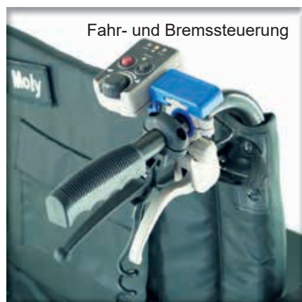
Fahr- und Bremssteuerung