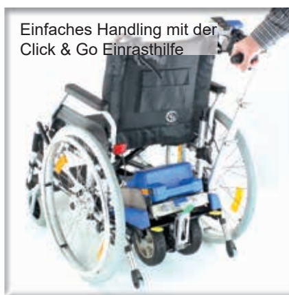
Einfaches Handling mit der Click & Go Einrasthilfe