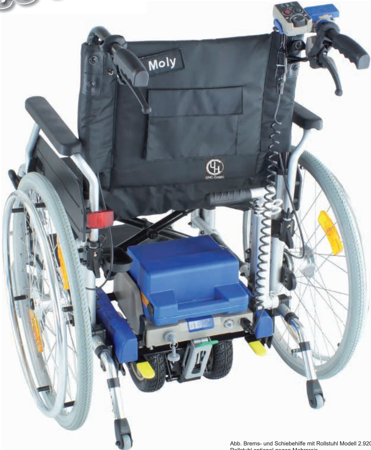
Abb. Brems- und Schiebehilfe mit Rollstuhl Modell 2.920 Moly Rollstuhl optional gegen Mehrpreis