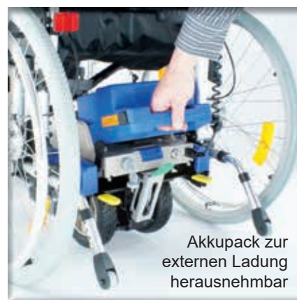
Akkupack zur externen Ladung herausnehmbar