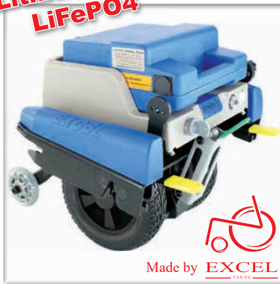
Universal-Halterung für viele Rollstuhl-Modelle

sicheres Fahren an Steigungen und Gefällen bis 15% dank einer optimalen Bodentraction gewährleistet.