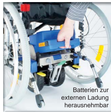
Batterien zur externen Ladung herausnehmbar