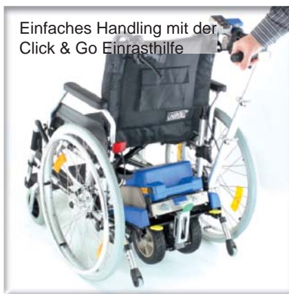
Einfaches Handling mit der Click & Go Einrasthilfe