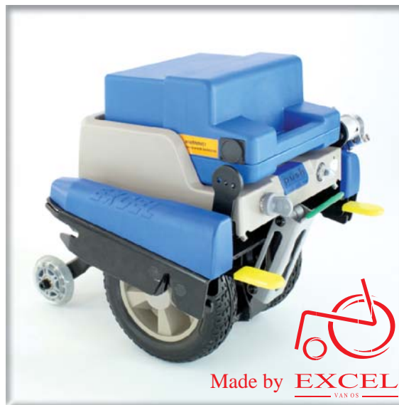
Universal-Halterung für viele Rollstuhl-Modelle

sicheres Fahren an Steigungen und Gefällen bis 15% dank einer optimalen Bodentraction gewährleistet.