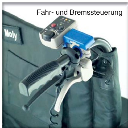
Fahr- und Bremssteuerung