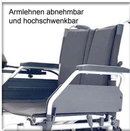
Armlehnen abnehmbar und hochschwenkbar