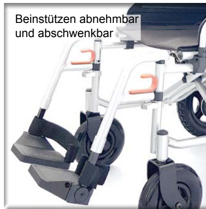
Beinstützen abnehmbar und abschwenkbar