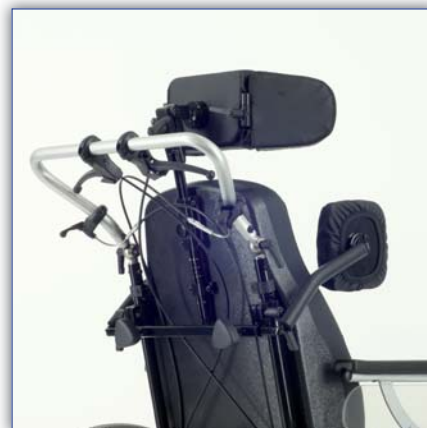
Kopfstütze und Pelotten optional