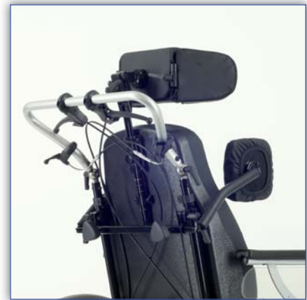
Kopfstütze und Pelotten optional