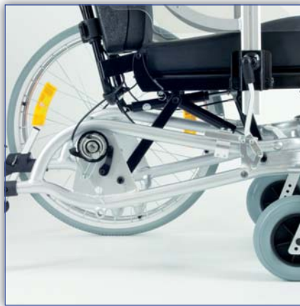
Aluminium-Rahmen aus Ovalrohr