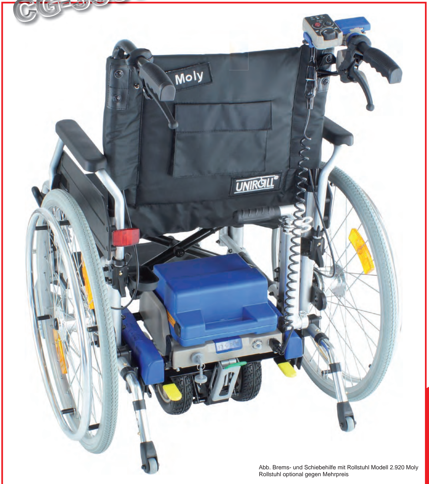
Abb. Brems- und Schiebehilfe mit Rollstuhl Modell 2.920 Moly Rollstuhl optional gegen Mehrpreis