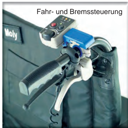
Fahr- und Bremssteuerung