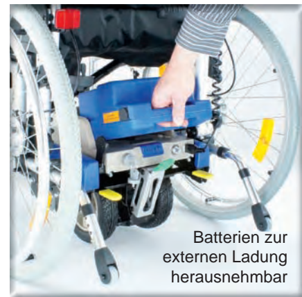
Batterien zur externen Ladung herausnehmbar