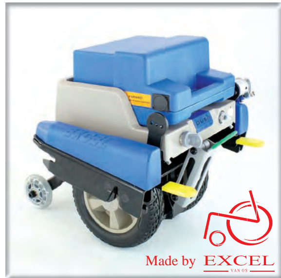
Universal-Halterung für viele Rollstuhl-Modelle

sicheres Fahren an Steigungen und Gefällen bis 15% dank einer optimalen Bodentraction gewährleistet.