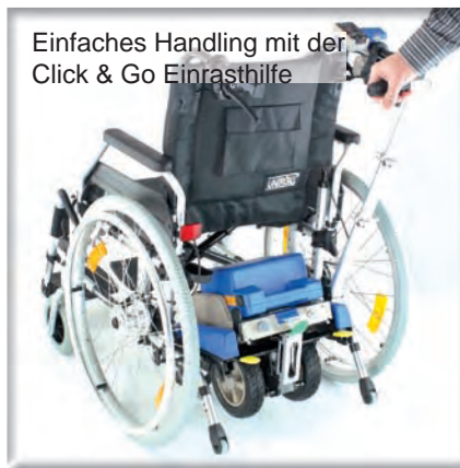
Einfaches Handling mit der Click & Go Einrasthilfe