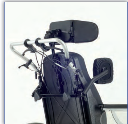
Kopfstütze und Pelotten optional