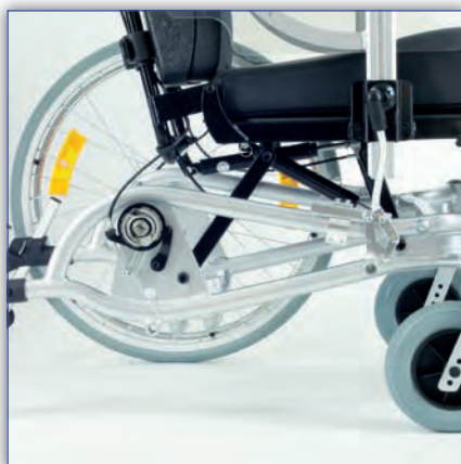
Aluminium-Rahmen aus Ovalrohr