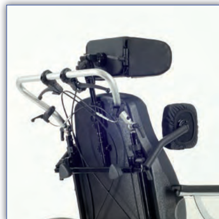
Kopfstütze und Pelotten optional